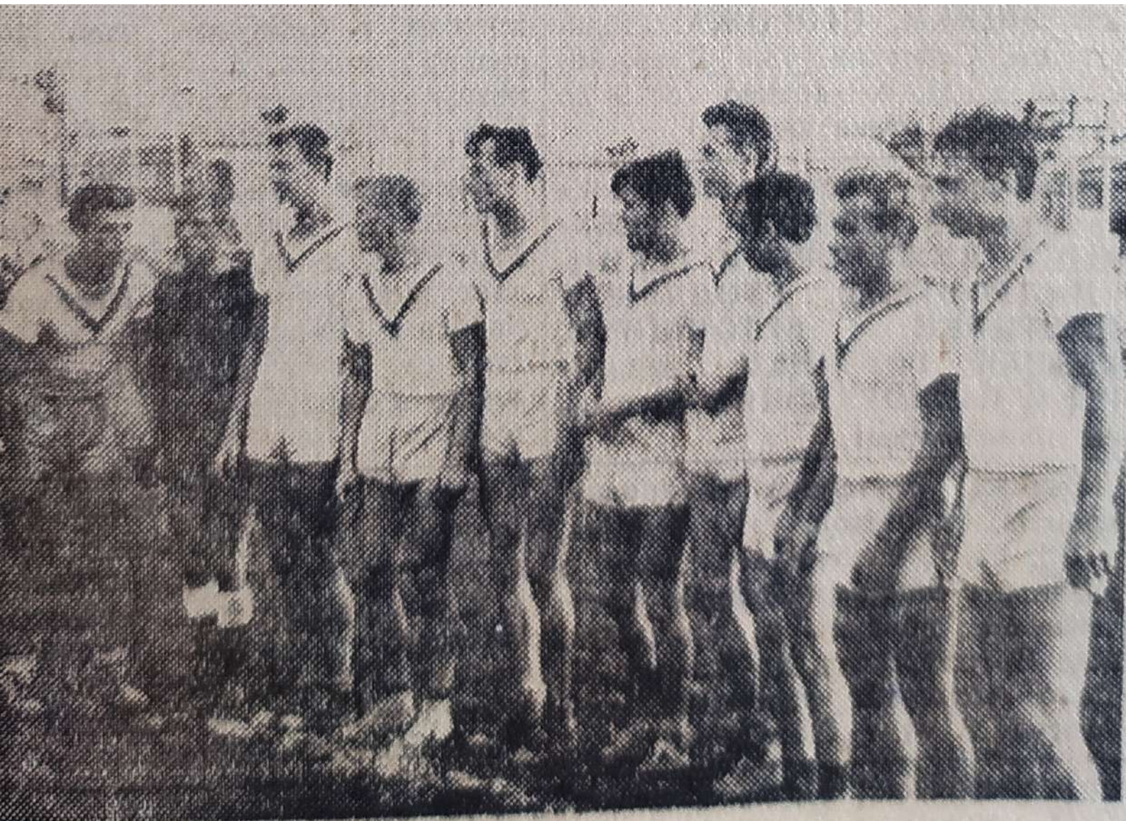
На снимке: команда по ручному мячу — чемпион Российской Федерации