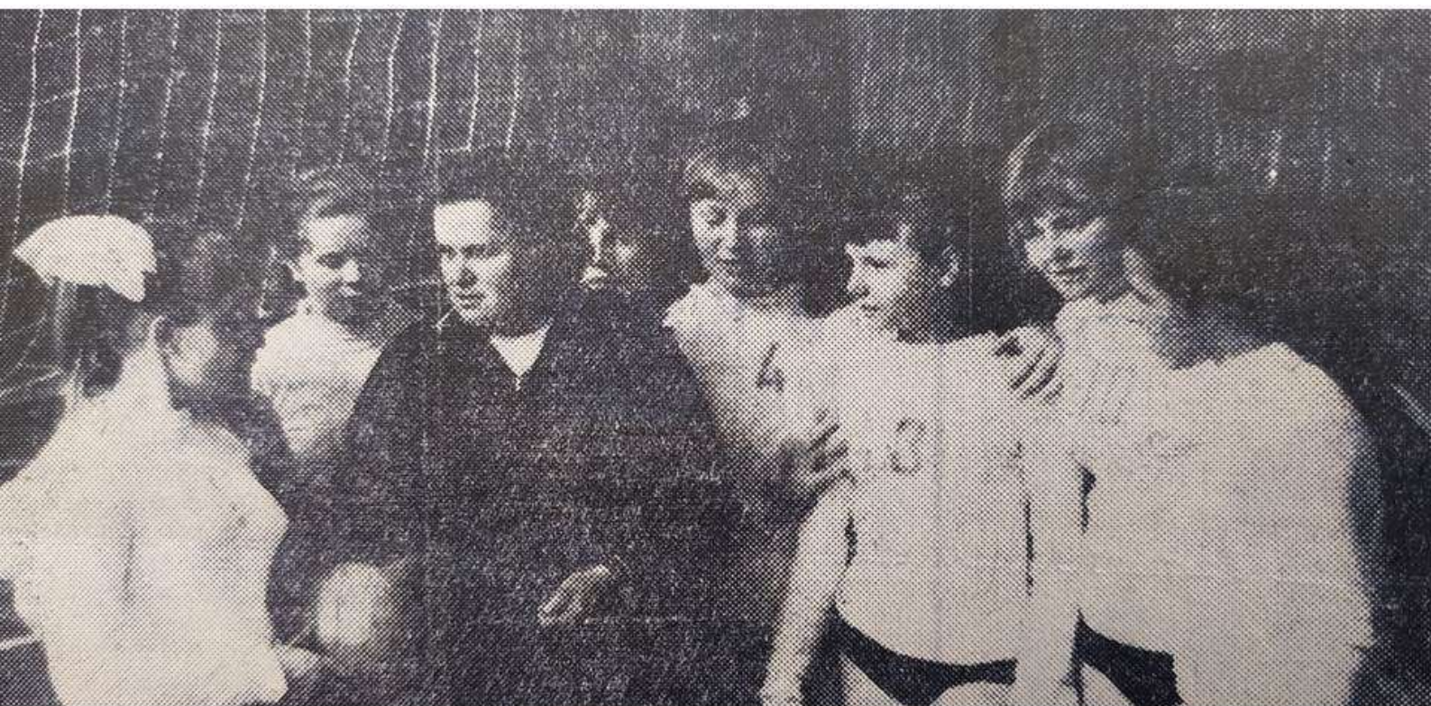
КОМАНДА волейболисток детской спортивной школы на протяжении не- скольких лет является по- бедителем первенства Мос- ковской области среди школьников.